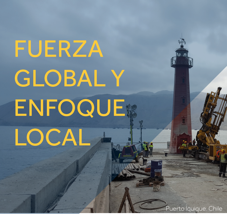
Puerto Iquique. Chile