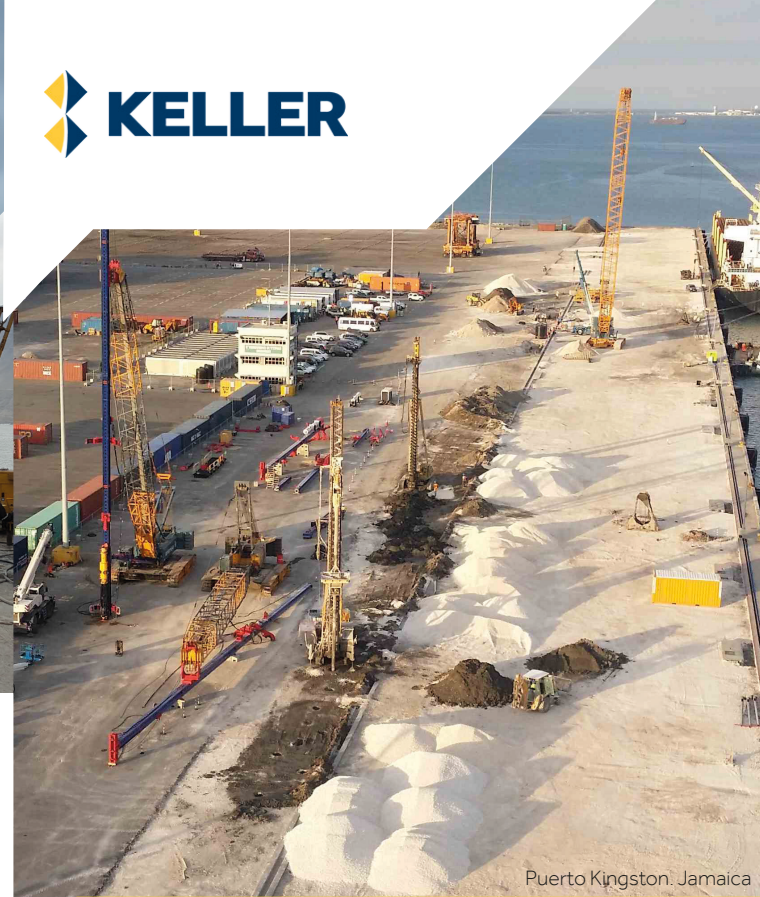
Puerto Kingston. Jamaica