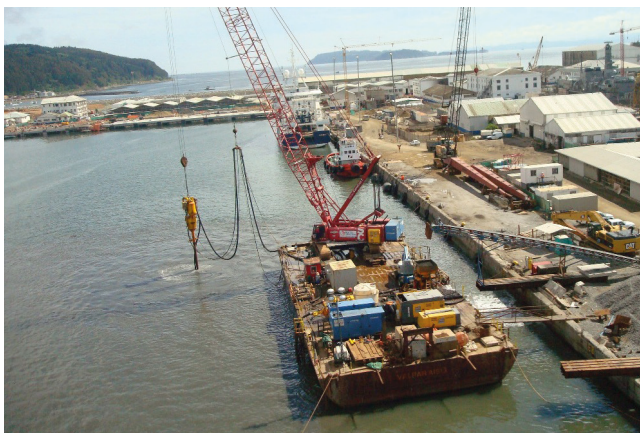
Puerto Asmar, Talcahuano. Chile

Keller reconoce la importancia de la sostenibilidad ambiental a nivel local y global.