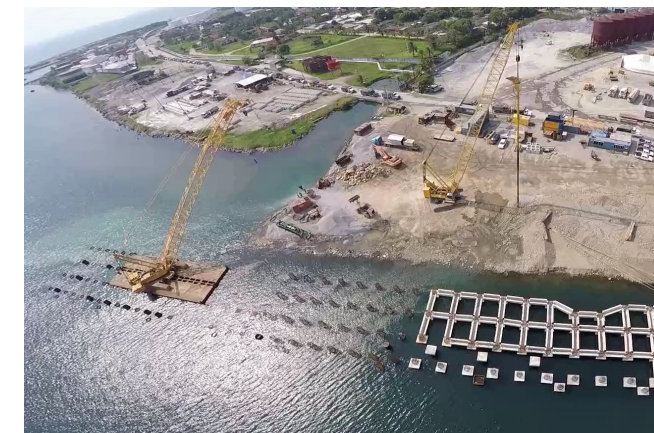
Puerto Cortés. Honduras