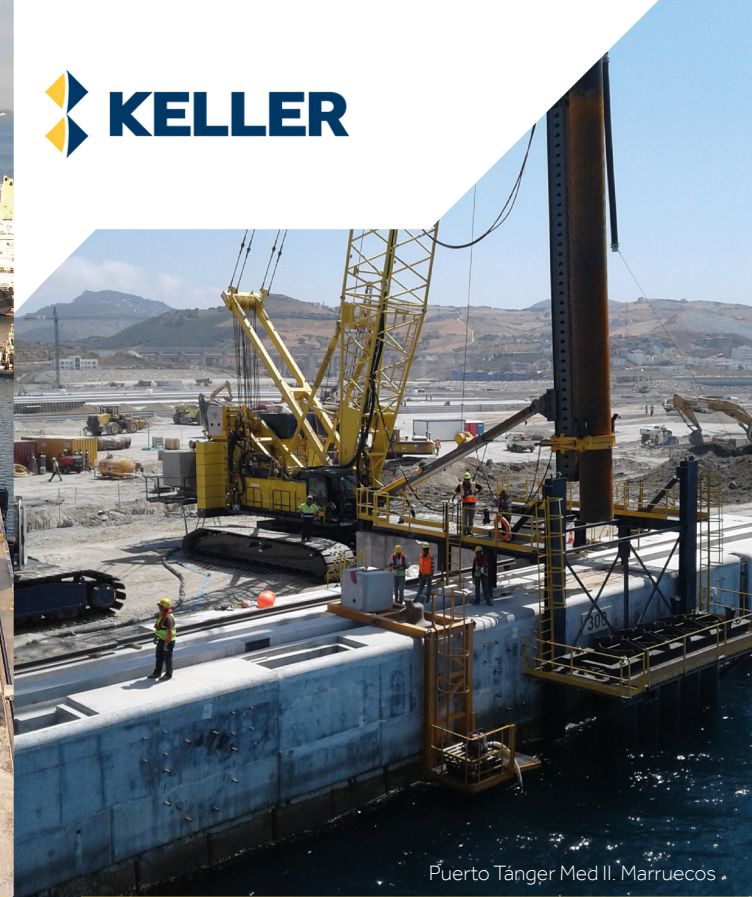
Puerto Tanger Med II. Marruecos

Keller proporciona servicios de diseño y construcción para estructuras portuarias. Las avanzadas capacidades de nuestros equipos internos de ingeniería y construcción, aseguran que proporcionamos soluciones rentables, adecuadas para su propósito y exitosas. Nuestra gama de técnicas marinas de pilotaje y mejora de suelos junto con nuestras capacidades generales de construcción son integrales.