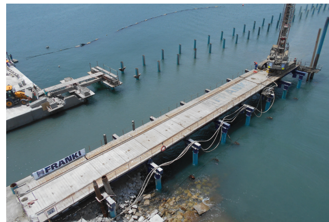
Puerto Elizabeth Jetties. Sudáfrica